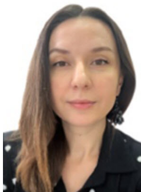
Абакумова Юлия Сергеевна

Документ СБЦП 81-2001-03 Справочник базовых цен на проектные работы для строительства «Объекты жилищно-гражданского строительства» частично утратил силу ( главы 2.1-2.10, 12 и таблицы 1-32, 39-42 главы 4 ) в связи с Приказом Министерства строительства и жилищно-коммунального хозяйства Российской Федерации от 28.11.2023 № 848/пр об установлении «Нормативных затрат на работы по подготовке проектной документации для строительства и реконструкции объектов жилищно-гражданского назначения», однако на сегодняшний день этот документ в силу не вступил. Как в таком случае посчитать стоимость проектных работ на строительство объектов гражданского назначения?