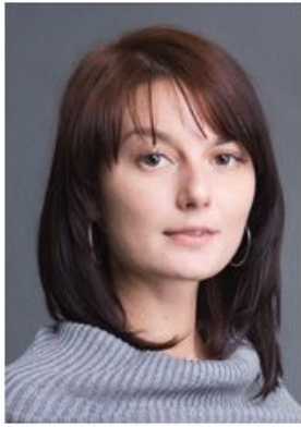
Григорович И. В.

Требуется ли в рамках инструктажей по охране труда обучать работников первой помощи и включать инструкцию по оказанию первой помощи в программу инструктажей на рабочем месте (периодических)?